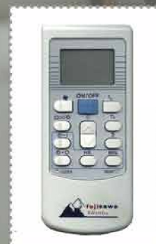
Mando a distancia