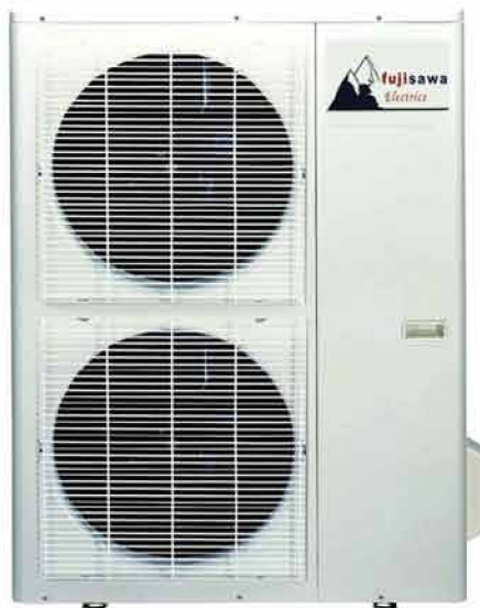
MODELO DIMENSIONES (mm)