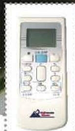
Mando a distancia