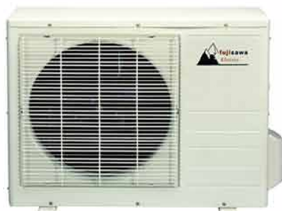
MODELO DIMENSIONES (mm)