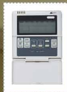
Mandos a distancia